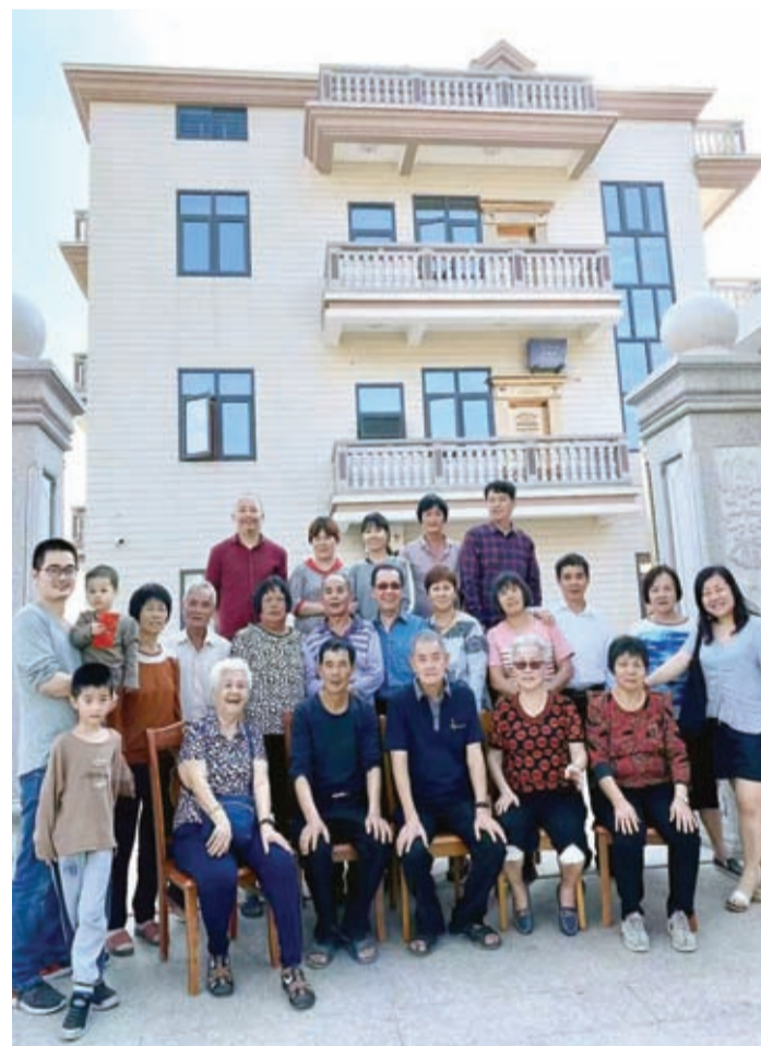
回新加坡前，海內外曾家親人合影留念。

曾氏網。龍山曾氏大宗祠(曾會榜眼府、宣靖祠) [EB/OL]. zeng.zupu.cn/wenhua/351720.jhtml.